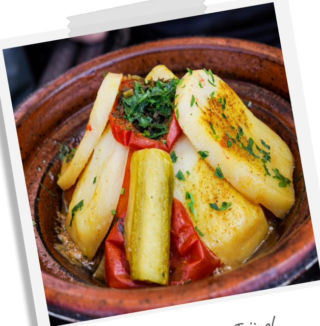
Die unverzichtbare Tajine!